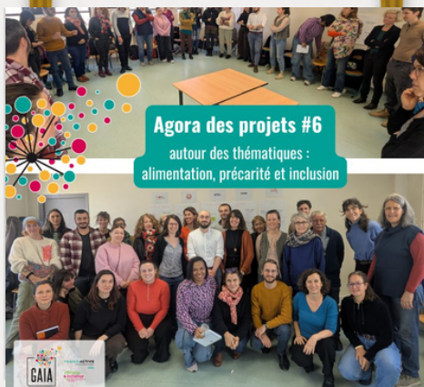
Agora des projets Grenoble