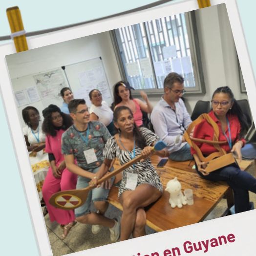
Formation en Guyane