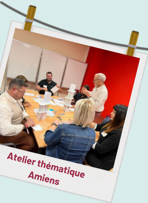
Atelier thématique Amiens