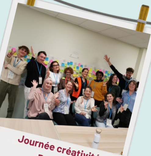
Journée créativité Promo 2