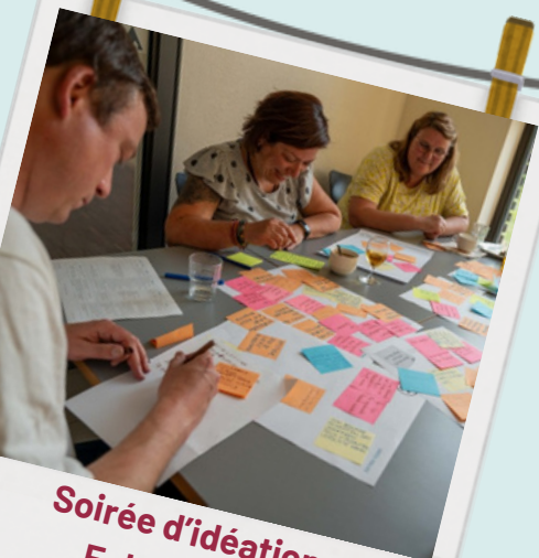
Soirée d'idéation Echternach