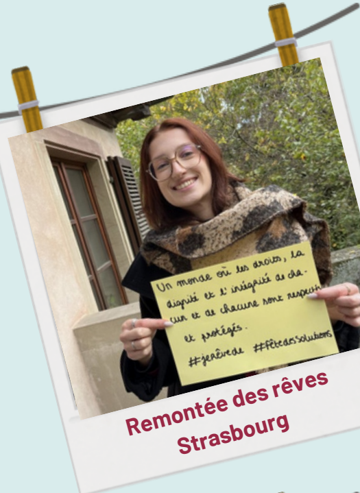
Remontée des rêves Strasbourg