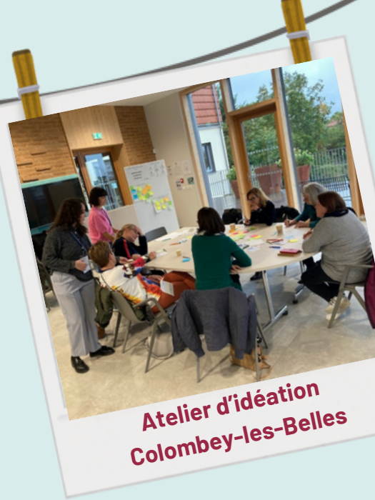
Atelier d'idéation Colombey-les-Belles