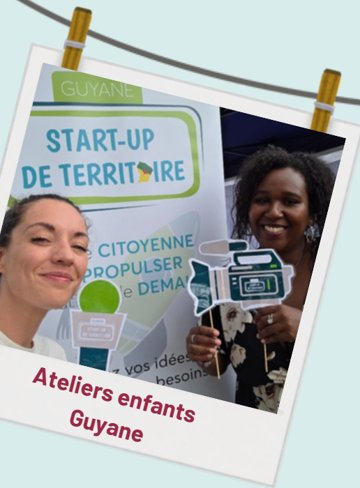
Ateliers enfants Guyane