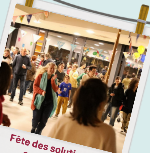
Fête des solutions Strasbourg