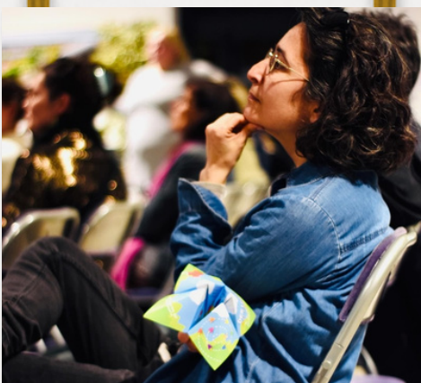
Soirée Mission Projets à Miramas