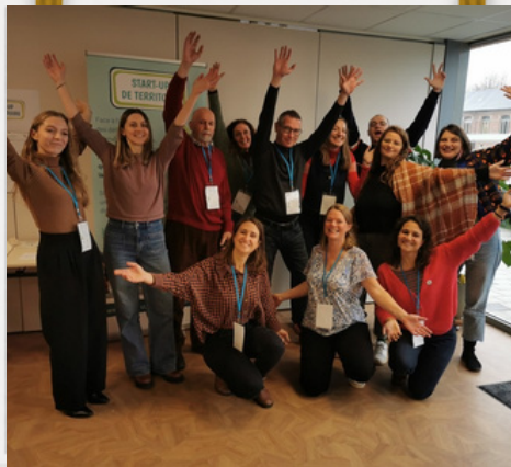
Lancement de la Promo 3