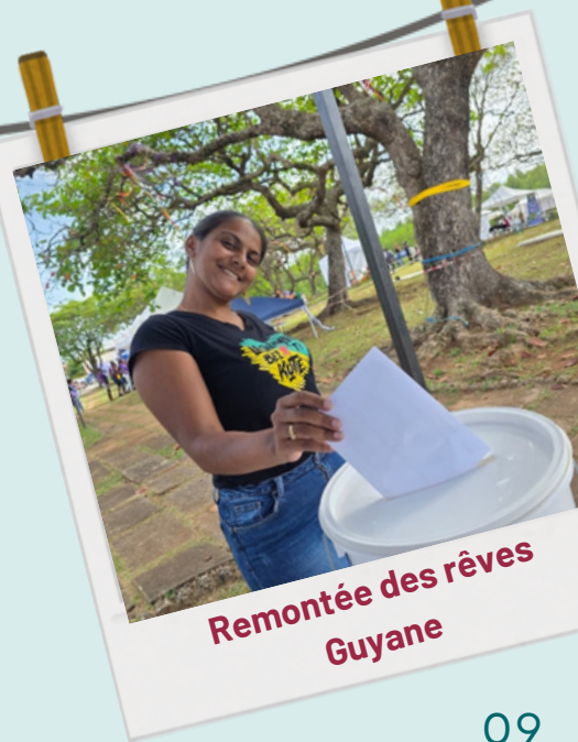
Remontée des rêves Guyane