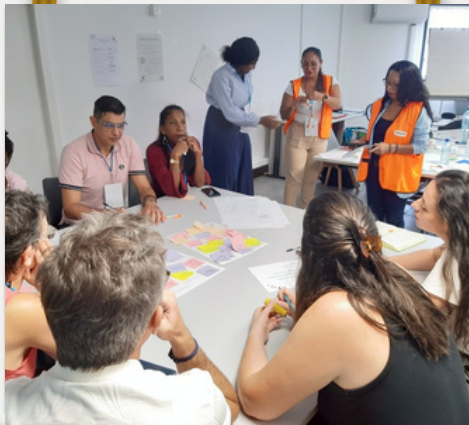
Formation en Guyane