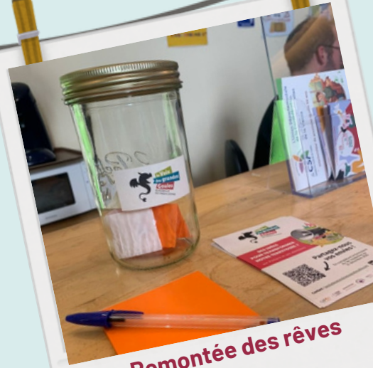
Remontée des rêves Poitiers