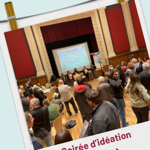
Soirée d'idéation Baccarat