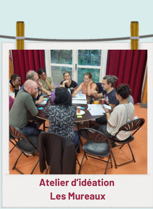
Atelier d'idéation Les Mureaux