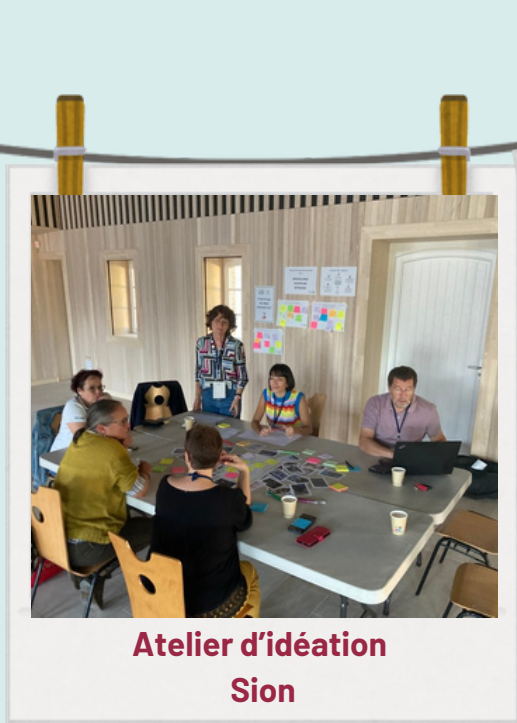
Atelier d'idéation Sion