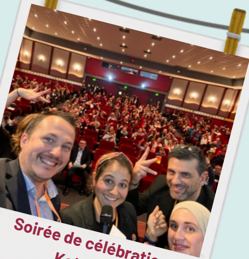
Soirée de célébration Katalyze