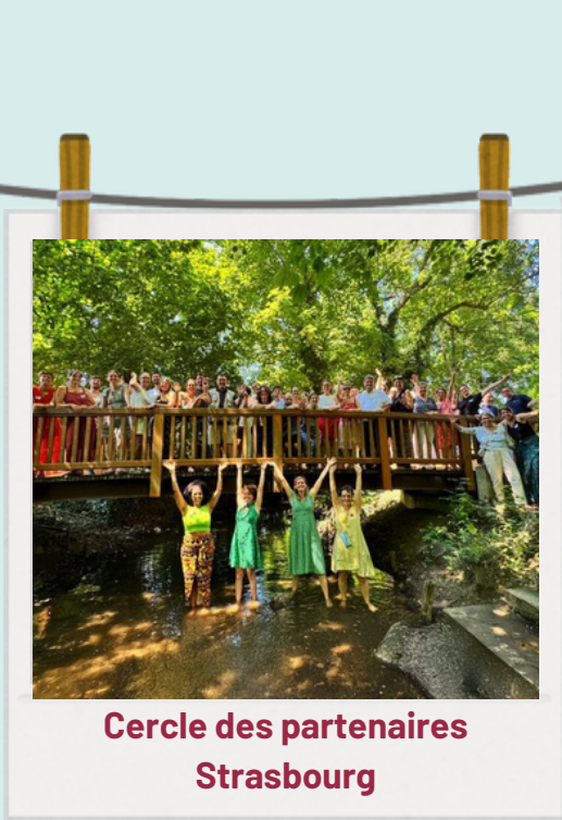
Cercle des partenaires Strasbourg