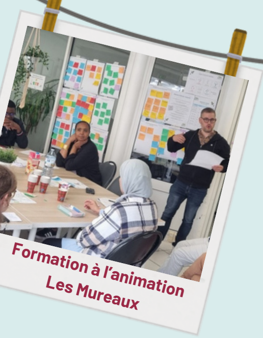
Formation à l'animation Les Mureaux