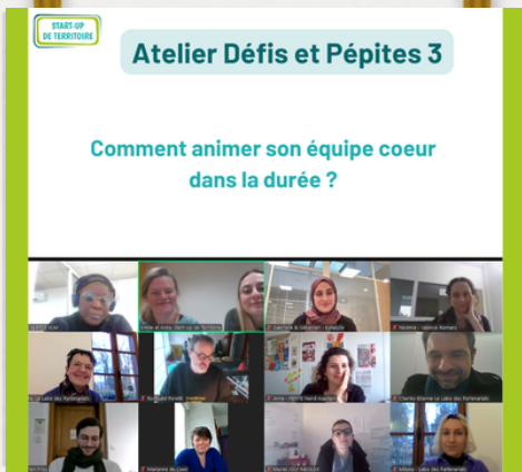
Défis et Pépites